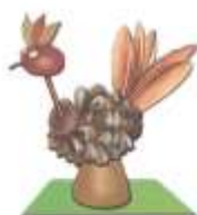
АИСТ ИЗ ШИШКИ.

Гуляете с ребенком в парке или планируете съездить в лес? Не забудьте насобирать шишек и потом попробовать из них сделать красивые фигурки.