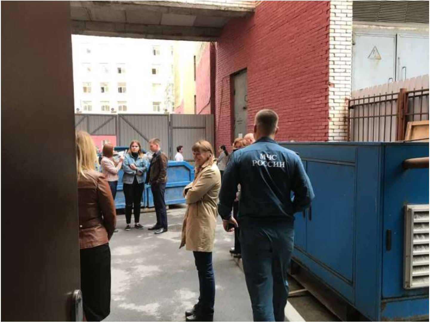
ОНДПР Центрального района 23.08.2018г.